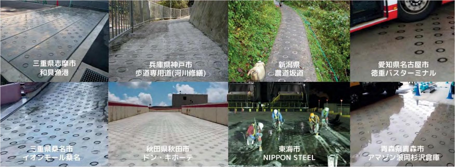
三重県志摩市 和具漁港