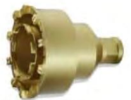
6インチ ダブルタイプ